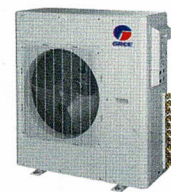
Condenseur 36 000 et 42 000 BTU/h