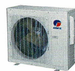
Condenseur 18 000, 24 000 et 30 000 BTU/h